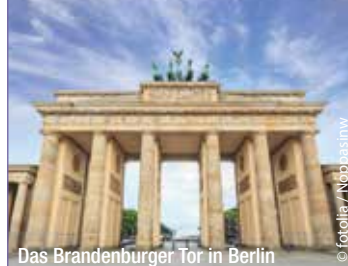
Das Brandenburger Tor in Berlin