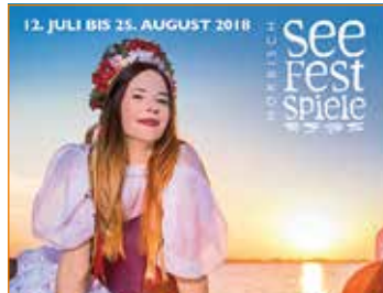
12. JULI BIS 25. AUGUST 2018