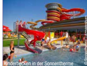
Kinderbecken in der Sonnentherme