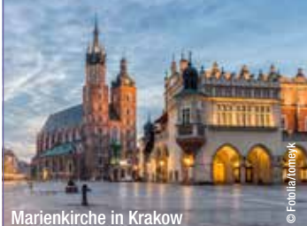
Marienkirche in Krakow