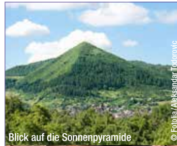
Blick auf die Sonnenpyramide