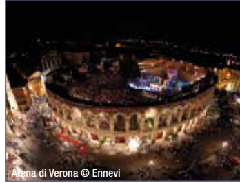
Arena di Verona

Preis: p. P. ab € 99,- Leistungen: Busfahrt und Ticket