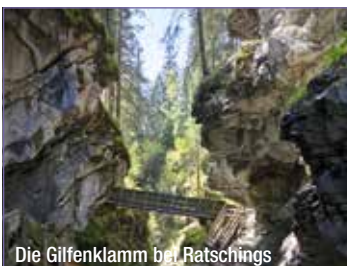
Die Gilfenklamm bei Ratschings

Preis: p. P. € 39,- Leistungen: Busfahrt & Maut