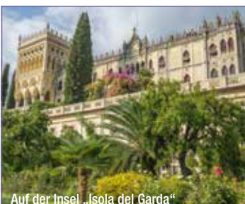
Auf der Insel „Isola del Garda“

Preis: p. P. € 35,- Leistungen: Busfahrt