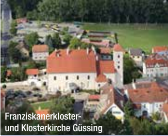
Franziskanerkloster- und Klosterkirche Güssing