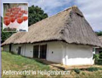
Kellerviertel in Heiligenbrunn