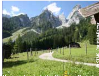
Herrliche Landschaft in Gosau am Dachstein

Preis: p. P. ab € 99,- Leistungen: Busfahrt und Ticket