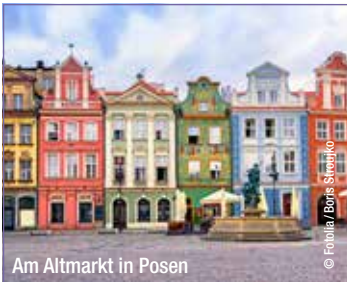
Am Altmarkt in Posen

Preis: p. P. € 39,- Leistungen: Busfahrt